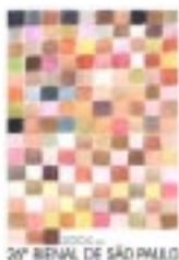
26ª BIENAL DE SÃO PAULO

...a 26ª Bienal Internacional de São Paulo! Este ano, a entrada é franca. O tema é “Território Livre”, derivado da idéia da “terra de ninguém”, não somente geográfica, política ou socialmente falando, mas principalmente como um campo estético, onde a arte desafia os limites da realidade. Boa parte da mostra deste ano é ocupada pela fotografia e por áudio-visuais, ora como obra completa, ora como parte/complemento de instalações. Alguns críticos dizem que a evolução da foto liberou a pintura do registro da natureza, deixando-a livre para buscar novos rumos. Em se tratando da multiplicidade de rumos, a arte contemporânea é pródiga e a 26ª Bienal Internacional de São Paulo é um bom registro dos novos caminhos. São 450 obras de 135 artistas de 62 países. A Bienal vai até 19 de dezembro de 2004 no Pavilhão da Bienal (Ciccilio Matarazzo), Portão 3, Parque do Ibirapuera em São Paulo. JF-imprensa@jfsp.gov.br ou gcampani@jfsp.gov.br