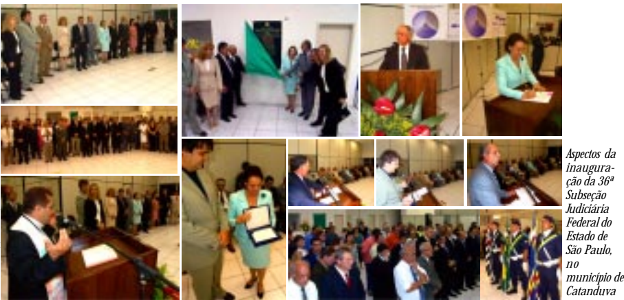
Aspectos da inauguração da 36ª Subseção Judiciária Federal do Estado de São Paulo, no município de Catanduva

Este serviço é elaborado pela Seção de Divulgação Social da Justiça Federal de Primeiro Grau / Seção Judiciária do Estado de São Paulo