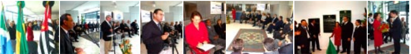
Cerimônia de inauguração das novas instalações na 10ª Subseção Judiciária do Estado de São Paulo e o Juizado Especial Federal, em Sorocaba