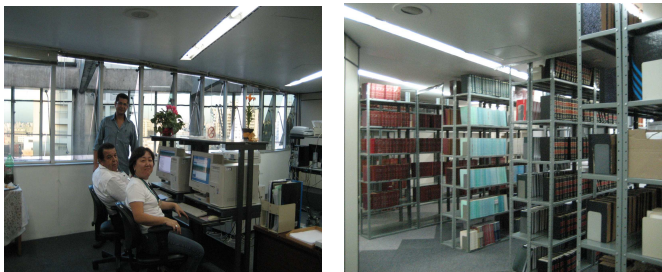
As novas instalações da Biblioteca do Fórum Criminal/Previdenciário

A Biblioteca do Fórum Criminal e Previdenciário mudou do 9º e 10º andar para o 17º andar. Yádia Siqueira Pequeno, bibliotecária do Fórum, conta que a mudança foi para melhor. “Ocupamos agora um andar inteiro deste Fórum, onde pudemos acomodar todo o acervo de quase 10 mil livros e periódicos. Temos uma sala de leitura arejada, espaçosa e agradável para estudo e entretenimento”, diz. (VPA)