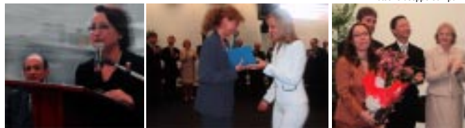
Inauguração da 31ª Subseção Judiciária do Estado de São Paulo, mais um passo da JF em direção ao Interior.