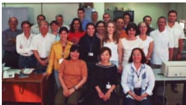
Equipe do NUFO

O NUFO é responsável pela maior parte dos registros no SIAFI (99,9%). Tudo o que é lançado lá gera relatórios contábeis que ficam sujeitos a averiguações pelos setores encarregados de exercer controle (SUCI, UCON, Conselho de Justiça, Tribunal de Contas). "Por isso é desejável que o servidor daqui tenha noções de contabilidade", salientou.