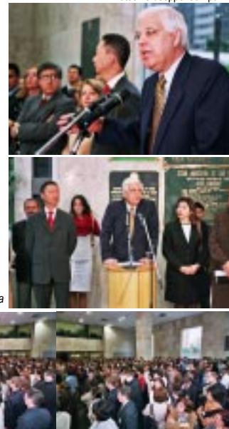
Corregedor-geral desembargador Baptista Pereira na cerimônia de abertura da Correição do Fórum Pedro Lessa