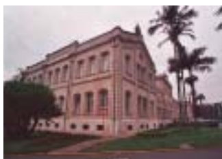
Abaixo: Escola de Agronomia Luiz de Queiroz e E.C. XV de Novembro