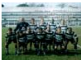
Funcionários comemoram 10º aniversário da JF/Piracicaba