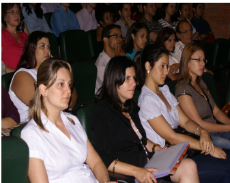
Servidores e estudantes assistem às palestras em Araraquara