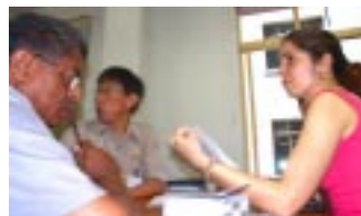
Pesquisa efetuada com o primeiro grupo de cursistas demonstra a diversidade de formação e preparo profissional dos que ingressam na Justiça Federal