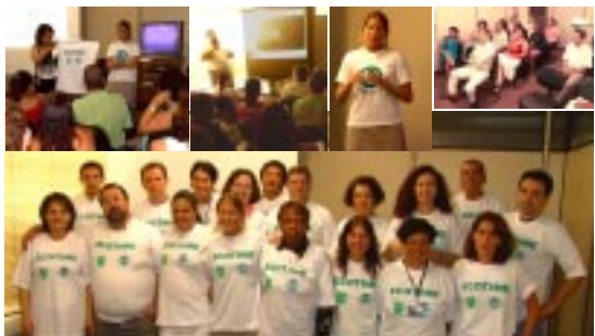
Os coordenadores do Programa de Gestão Ambiental realizam o 1º Encontro com os participantes do ECOTIME: "Espero contar com vocês para fazer desse projeto um grande sucesso"

DESENVOLVIMENTO SUSTENTÁVEL "Quando você sair de um lugar, deixe-o melhor ou pelo menos igual ao encontrado"